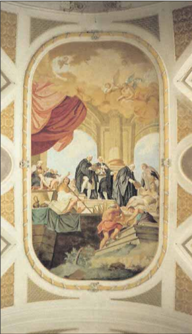
Verpflegung der Kranken durch die Malteser. Die Decke malte Franz Seraph Kirzinger im Jahr 1783 für die Ebersberger Klosterkirche.

Landkreis Ebersberg (ct/pm) - In einer Reihe von Kirchen des Landkreises Ebersberg finden sich überaus wertvolle, jedoch häufig wenig beachtete Deckengemälde der Barockzeit.