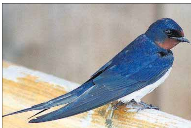
Die ersten Frühlingsboten sind im Landkreis gesichtet worden: Die Rauchschnalbe hat Einzug gehalten. Leider ist ihre Anzahl in den letzten Jahren stark gesunken.

Ebersberg (ct) - Jetzt ist der Winter wirklich vorbei: Im Landkreis sind die ersten Rauchschnalben eingetroffen und haben den Frühling mitgebracht. In der ersten Zeit nach der Rückkehr jagen die Schwalben vor allem an Gewässern, wo sie zu dieser Jahreszeit genügend Insekten finden. Seit zwei bis drei Tagen können die Schwalben auch über Feldern und an Bauernhöfen beobachtet werden.